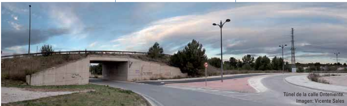
Túnel de la calle Onteniente.