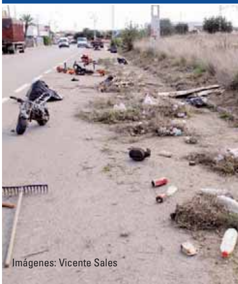
Imágenes: Vicente Sales