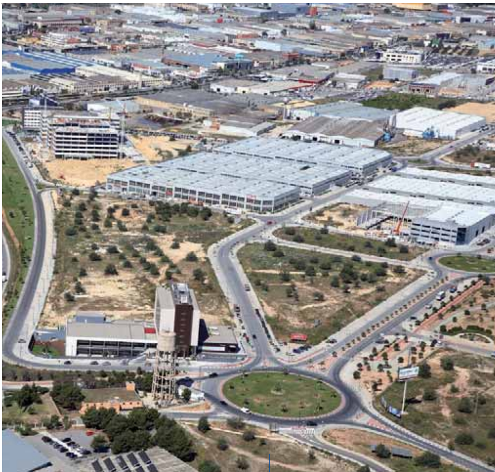
Imagen aérea del Parque Empresarial Táctica

na, ya que no constituye una zona de mucho tránsito".